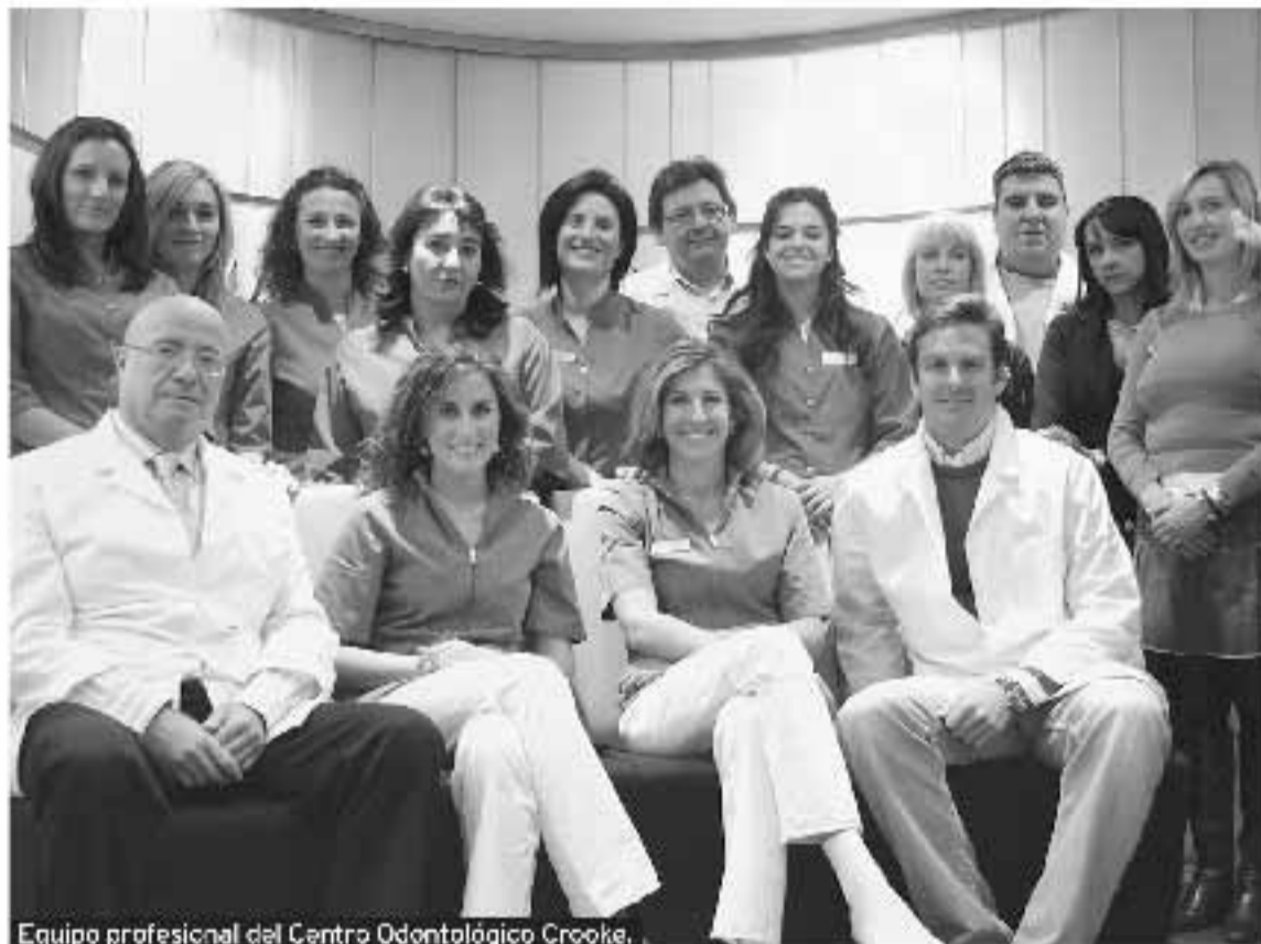
Equipo profesional del Centro Odontológico Crooke.

¿Cómo podría resumir la experiencia y trayectoria del centro? Crooke Centro Odontológico es una clínica en constante renovación y con un continuo esfuerzo por mejorar. Apostamos por invertir en todo lo que consideramos un beneficio para nuestros pacientes y nuestros empleados, y así trabajamos con la satisfacción de ofrecer siempre lo mejor.