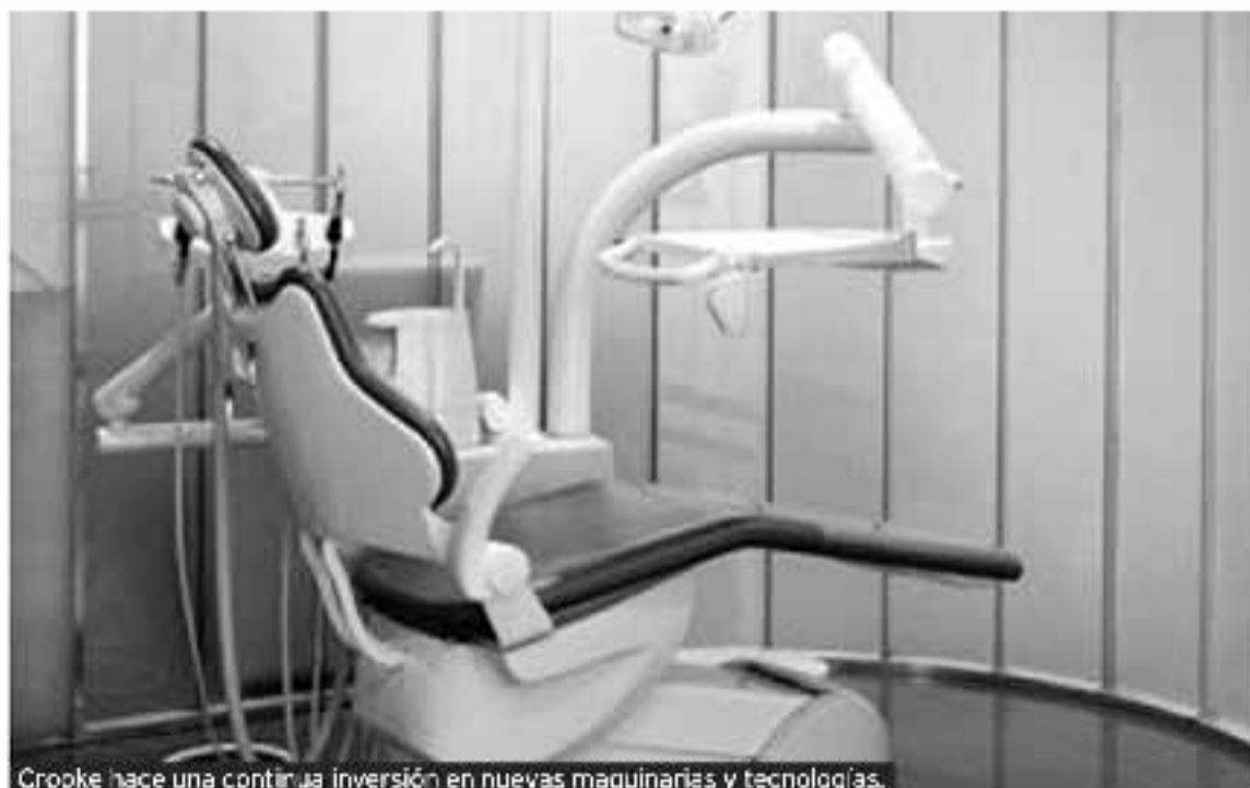
Crooke hace una continua inversión en nuevas maquinarias y tecnologías.