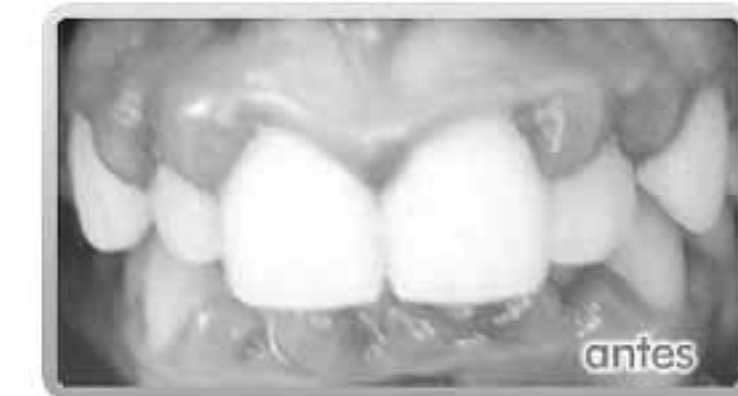
Antes y después de un tratamiento de reconteorneo gingival.

La mayoría son pacientes a partir de los 40 años que notan sensibilidad en sus dientes o sangrado al cepillado. Pero también tenemos pacientes jóve-