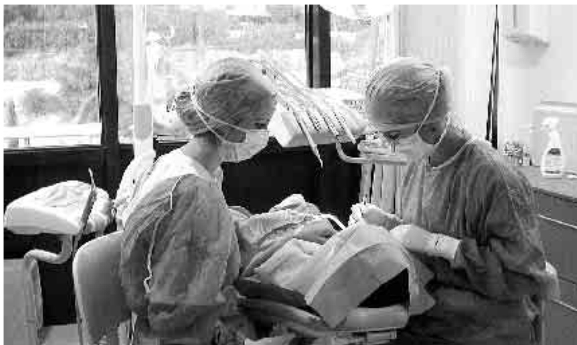
Las nuevas tecnologías forman parte del trabajo diario de la clínica CROOKE.

‘Teeth in a hour’ es una técnica de colocación de implantes y dientes guiada por ordenador, clínica pionera en esta técnica