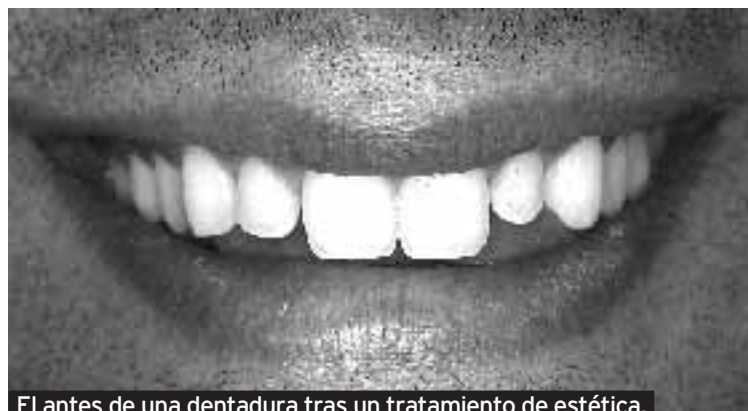
El antes de una dentadura tras un tratamiento de estética.

Sobre todo se investiga en relación a las cerámicas que se usan para las prótesis, para que sean igual de resistentes que el metal y mejoren la estética de forma que sea imposible distinguir una funda de un diente natural. También se mejoran las técnicas quirúrgicas que hacen que la encía que hay alrededor de un implante o de una prótesis sea correcta para que no se note que hay una prótesis en boca