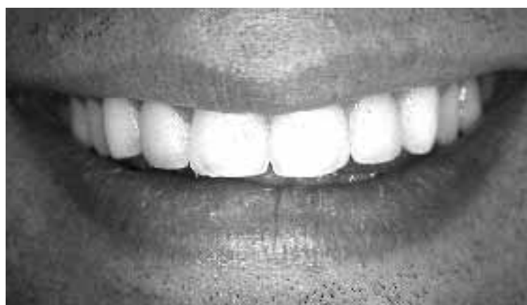
El después de la dentadura tras el tratamiento de estética.